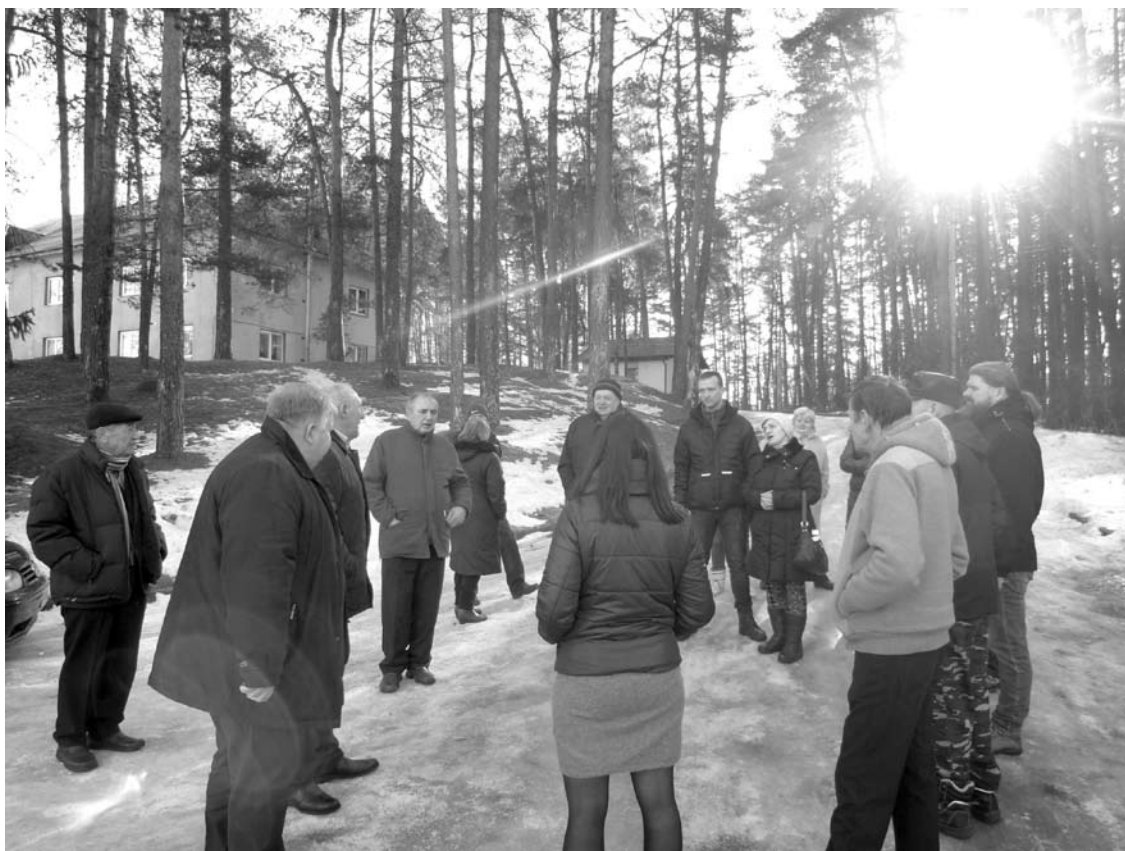
Gintis nuo požeminės atliekų konteinerių aikštelės po daugiabučių langais susirinko per 20 Mindaugo gatvės gyventojų.